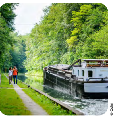
Musée du Touage - Bellcourt