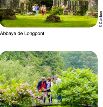
Jardins - Vieux-Maisons