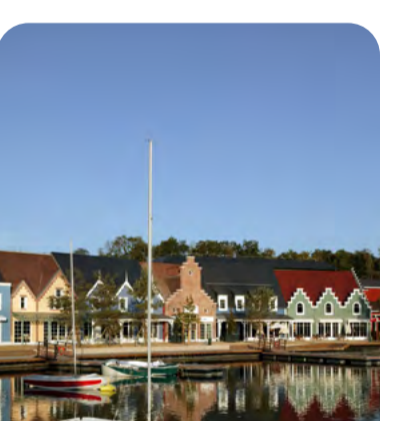
Center Parcs - Chamouille