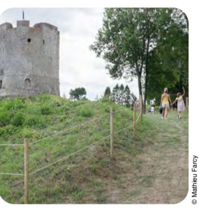
Château fort - Guise