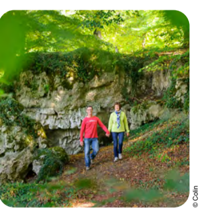
Forêt de Saint-Gobain