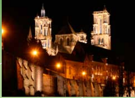
Kathedraal Notre Dame

Deze pittoreske binnenhof gaf vroeger toegang tot een herberg. In 1618 kwamen Lodewijk XIII en zijn echtgenote Anna van Oostenrijk terug van een belevaart in Liesse waar ze Onze-Lieve-Vrouw van Liesse voor een troonopvolger aanriepen.