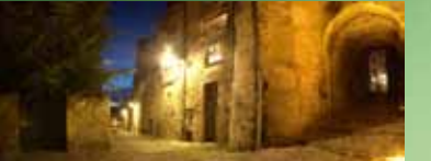
Poort 'les Chenizelles'

De abdij van Sint-Vincentius die zich buiten de stad bevond, heeft hier een refugium laten bouwen waar de pelgims konden overnachten en waar de geestelijken hun toevlucht konden zoeken tijdens de vijandelijke invallen.