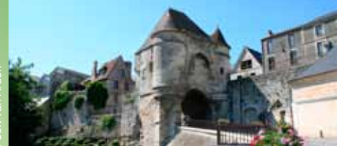
Poort van Ardon

Een van de middeleeuwse ingangspoorten uit de XIIe eeuw. Buiten de stadswallen ziet u de groenzone "la cuve Saint-Vincent", vroeger wijngaarden waarvan de wijn "le cru du Clos Saint-Rémy" en "le cru de la Goutte d'Or" geserveerd werden tijdens het banket dat volgde op de kroning van de koningen van Frankrijk in Reims.