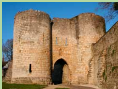
Poort van Soissons

Ingangspoort tot de stad, in de XIIe eeuw gebouwd, door 2 torens met schietgaten omringd, en die vroeger 2 wachtkamers bezat. De scheve toren van Dame Eva begon reeds in de XIIe eeuw langzaam naar beneden te glijden.