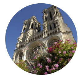
LAON - CATHÉDRALE

> Tarif : 6 € (réduit : 3 € / gratuit - de 6 ans) > Durée : 1h